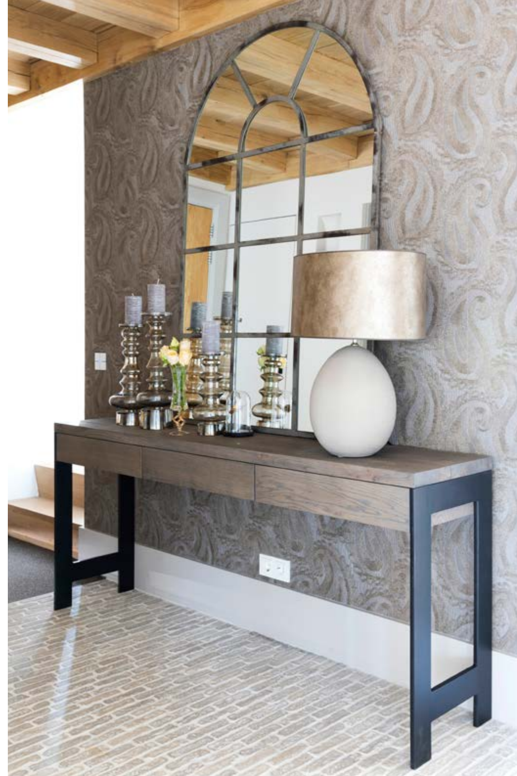
In de hal is op de muren Élitis-behang Pearles toegepast. De tafel en de glazen kandelaars zijn van MD, de lamp van Duran (alles Violier at Home). De spiegel hebben de bewoners al langer. Op de vloer liggen Castle Stones van 't Achterhuis in Udenhout. Taatsdeuren van Roukens in Elspeet bieden toegang tot de woonkamer, keuken en speelkamer. Het schilderij kochten de bewoners via Violier at Home.